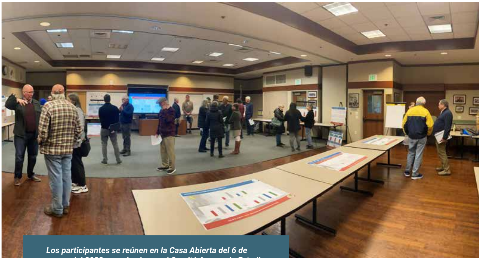
Los participantes se reúnen en la Casa Abierta del 6 de marzo del 2023 organizada por el Comité Asesor de Estudio de Tarifas dirigido por Ciudadanos.

Promover la conservación y la eficiencia del agua , para que los clientes que usan más agua tengan un incentivo económico para conservar.